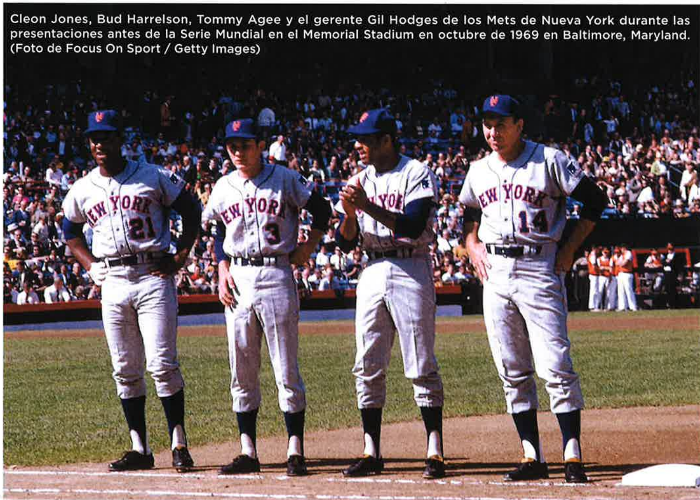
Cleon Jones, Bud Harrelson, Tommy Agee y el gerente Gil Hodges de los Mets de Nueva York durante las presentaciones antes de la Serie Mundial en el Memorial Stadium en octubre de 1969 en Baltimore, Maryland.

Un día, en el entrenamiento de primavera de 1969, Jerry Grote estaba hablando con los lanzadores más jóvenes del equipo: Tom Seaver, Jerry Koosman, Gary Gentry, y les dijo: "¡Creo que podemos ganar todo este año!"... ¡Creo que podemos ganar todo este año!"